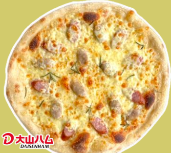
④2種のソーセージと ローズマリーのピッツァ ¥1,563