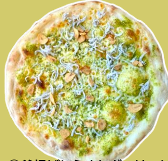
⑥釜揚げしらすとガーリックの ジェノベーゼピッツァ ¥1,661