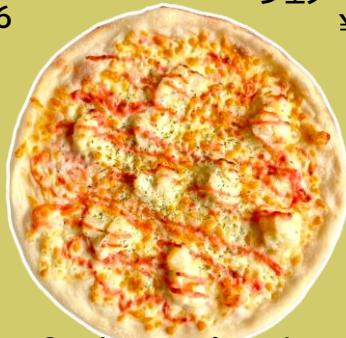
⑧明太子マヨポテトピッツァ ¥1,563