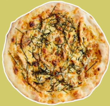
②大山どりの照り焼きピッツァ ¥1,760