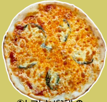
①トマトとバジルの マルゲリータ ¥1,445