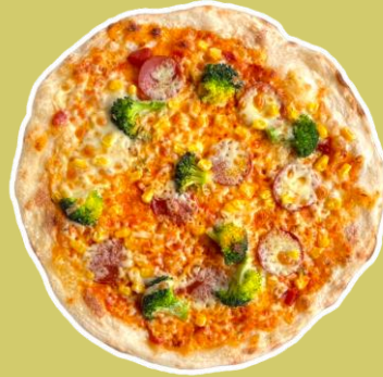
③サラミと大山産ブロッコリーの ミックスピッツァ ¥1,858